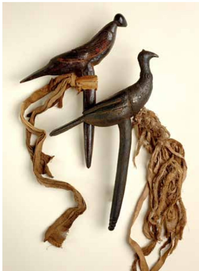
1. Oiseaux en bois et métal utilisés par les chamans Gurung durant les rituels funéraires pour leur fonction psychopompe.

7. Informations aimablement communiquées par Jean-Christophe Kovacs – ornithologue.