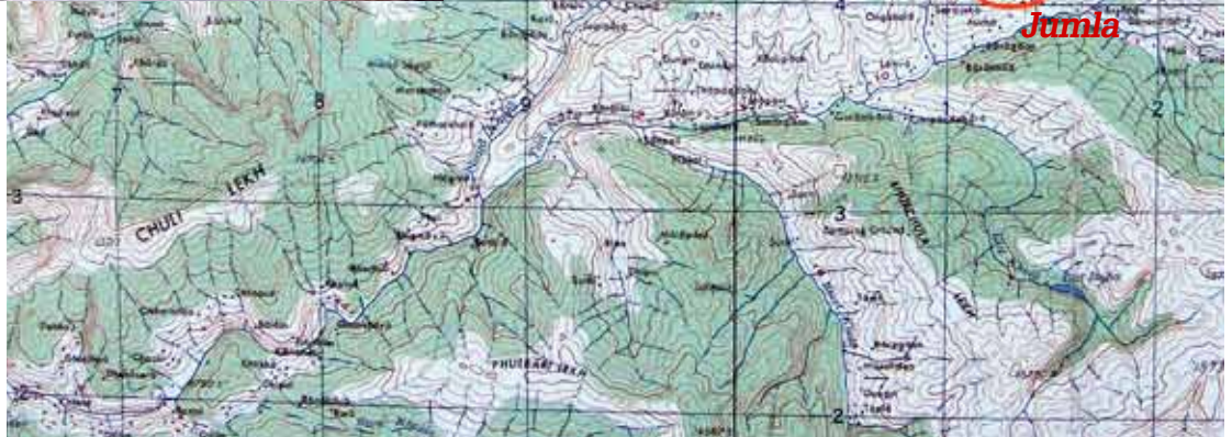
Carte avec localisation de Jumla, Dama, Ruga et Chapra