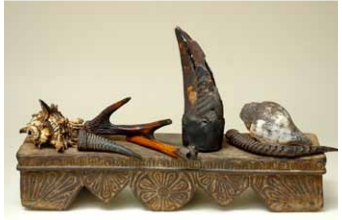
Sur un autel différents objets chamaniques sont disposés dont un bec de calao Aceros nipalensis