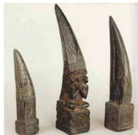
3. Trois phurbus sculptés en bois en forme de bec de calao