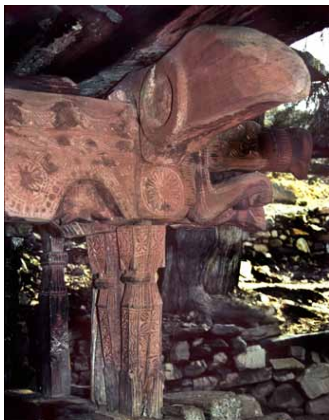
Sanctuaire de Ruga avec motif architectural en forme de bec de calao.