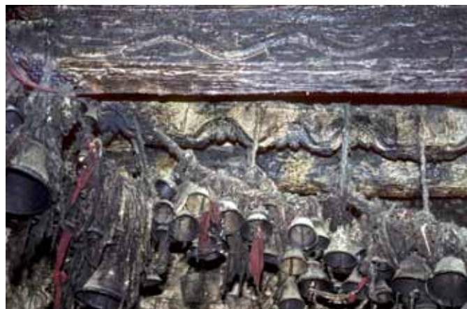
1 Présence d'un Naga sur une poutre dans un sanctuaire de la région de Mugu