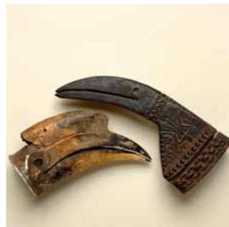
2. Bec de jeune calao-pie oriental, la base fermée par une plaque de métal et bec de substitution en bois sculpté.