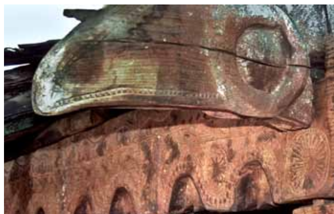
Sanctuaire principal de Ruga avec motifs architecturaux en forme de bec de calao.