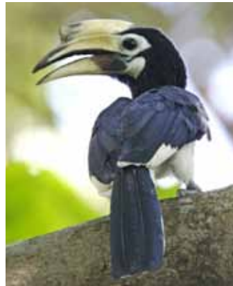
Les 3 types de Calao : 1 Calao pie oriental 2 Buceros bicornis 3 Aceros nipalensis