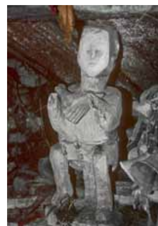
2,3 et 4 Divinités animistes au sanctuaire de Ruga