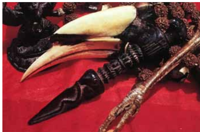
Accessoires d'un chaman Gurung avec un bec de calao Buceros bicornis

9. Leurs travaux sont consultables sur '3 Chamans – Rencontres chamaniques au Népal' – Naïve – 2014 et sur le DVD '3 Chamans' – un film documentaire d'Aurore Laurent et Adrien Viel – production Hong Kong connection et épicurie films.