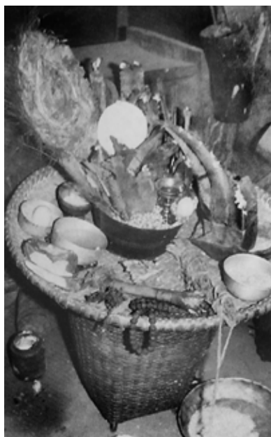
Dessin et photo d'un autel de chaman Tamang avec bec de calao et phurbu