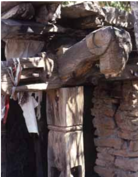
Sanctuaire dans le village de Rara

Il s'agit des sanctuaires de Ruga, région à l'ouest du Népal et plus à l'ouest aussi de Mugu. (Voir carte ci contre)