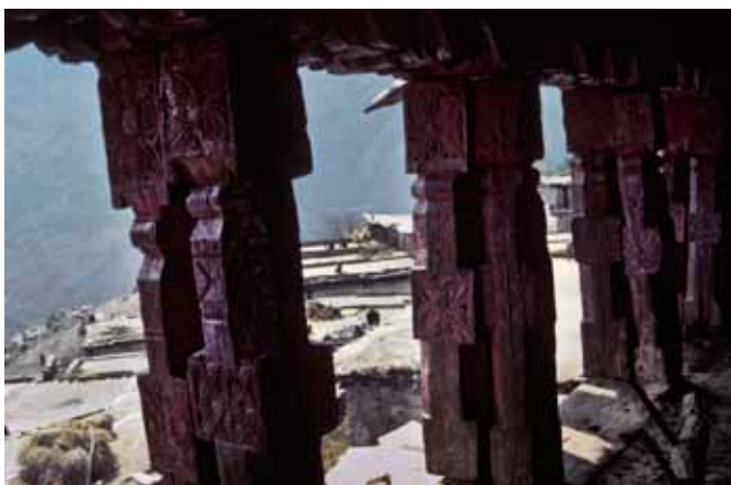
1 Sanctuaire de Ruga