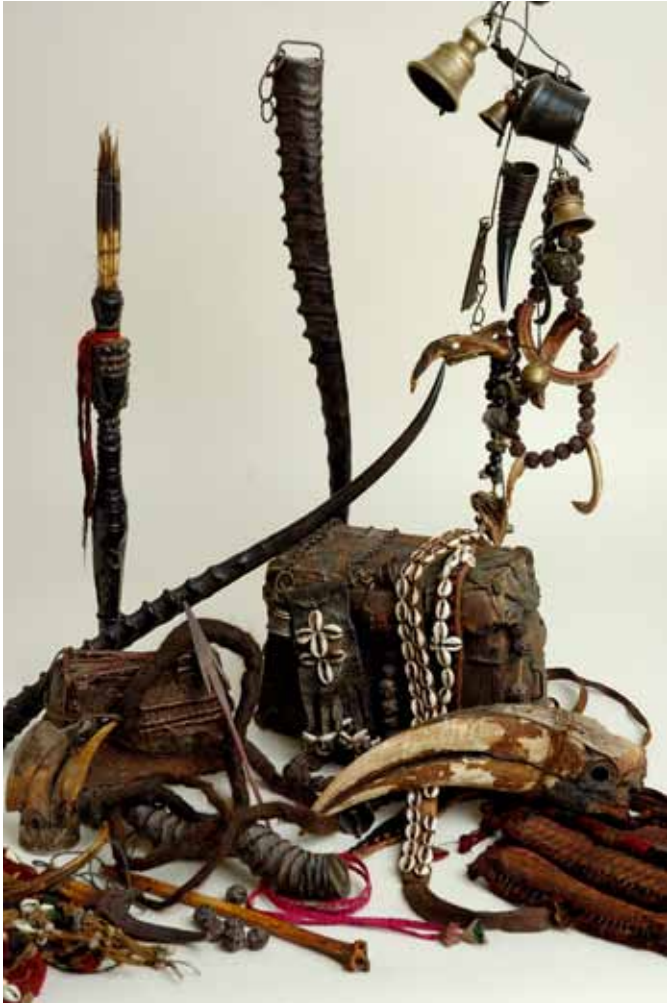
Ensemble de différents objets chamaniques avec 2 phurbus constitués de becs de calao-pie oriental.